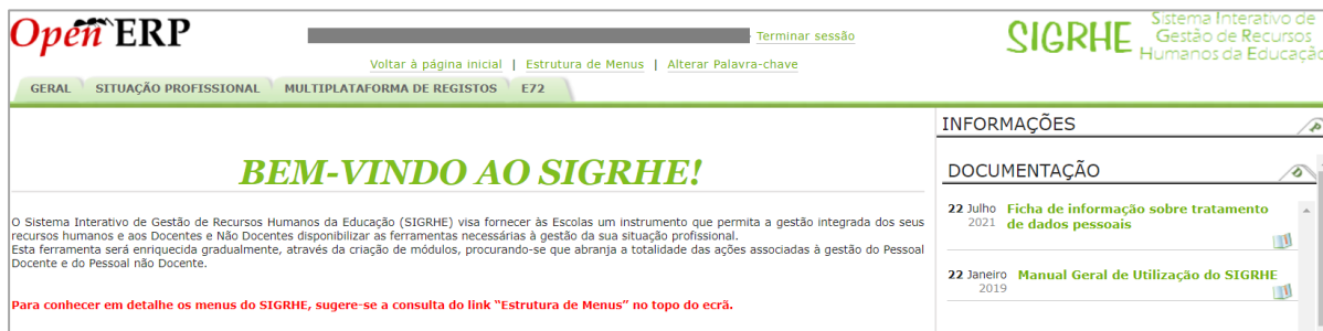
Imagem 1 - Ecrã Inicial