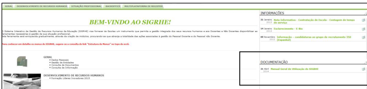
Imagem 2 - Ecrã inicial

A aplicação encontra-se otimizada para o Google Chrome e o Mozilla Firefox, sendo compatível também com o Apple Safari, o Opera e o Microsoft Internet Explorer 8, pelo que se aconselha a atualização do software de acesso à internet para as referidas versões, para uma melhor utilização da aplicação.