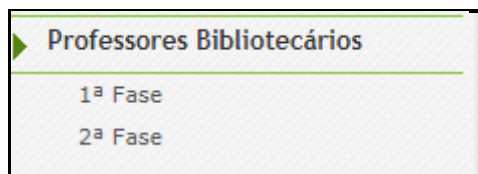
Imagem 3 - Separador Professores Bibliotecários 2018

Nesta fase deve selecionar as opções Professores Bibliotecários e, posteriormente, 2ª Fase para efetuar a indicação dos docentes.